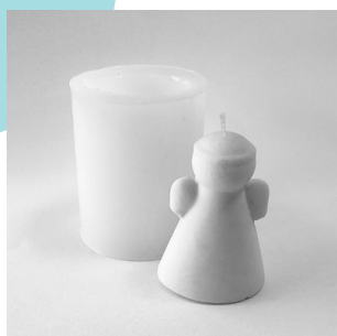
Art. 6511 en 6512 Engel klein en groot