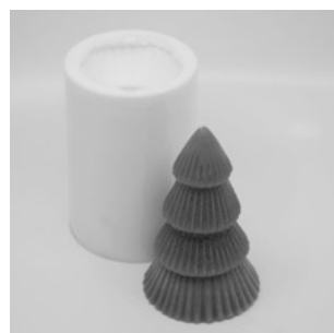
Art. 6505 en 6506 Kerstboom ribbel klein en groot