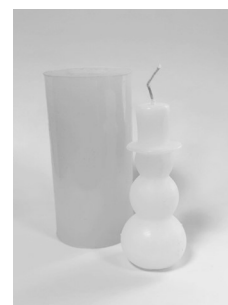
Art. 6510 Sneeuwpop ø 40 x 90 mm

De trendkleuren bieden een handige richtlijn, maar vergeet niet dat er geen regels zijn als het om creativiteit gaat. Een mooie combinatie van kleuren uit verschillende seizoenen kan juist verrassende resultaten opleveren. Denk bijvoorbeeld aan het maken van kaarsen in diverse vormen, maar in dezelfde kleurtinten, en plaats deze samen voor een speels, bosachtig effect. Zo ontstaat een harmonieuze en toch creatieve sfeer in het interieur.